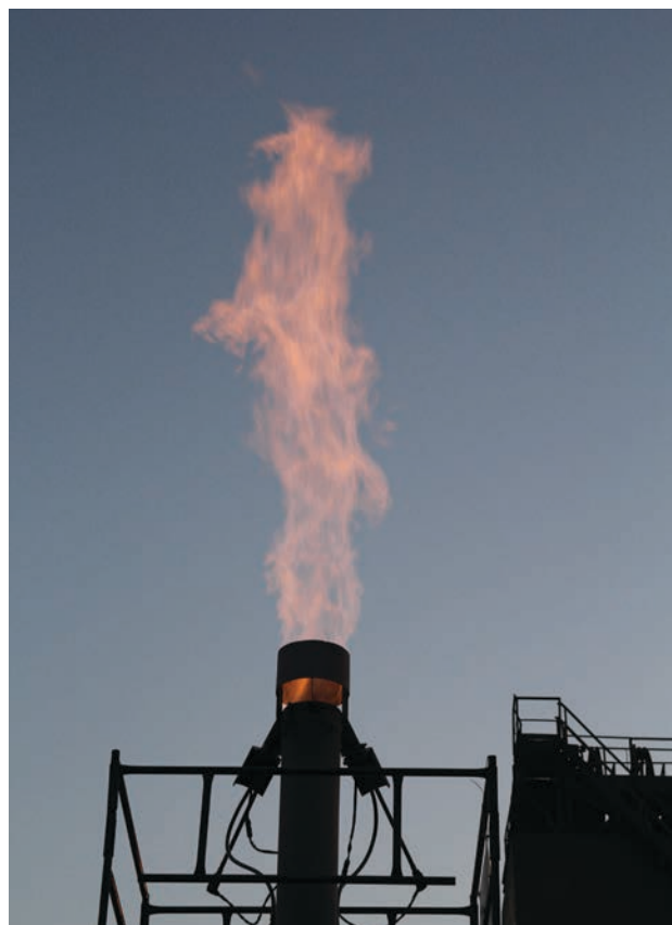
Fot. Instalacja do ciśnieniowej symulacji procesu podziemnego zgazowania węgla

Demonstracyjna instalacja PZW stanowi ostatni etap przed wdrożeniem technologii w skali przemysłowej. Obszarem zastosowania jest górnictwo węgla kamiennego, szczególnie w obrębie GZW w rejonach, w których kończona jest eksploatacja metodami górnictwami z przyczyn ekonomicznych lub naturalnych (zbyt duża głębokość zasobów) a także energetyka, szczególnie wytwarzanie ciepła i energii elektrycznej w układach średniej mocy dla zastosowań lokalnych.